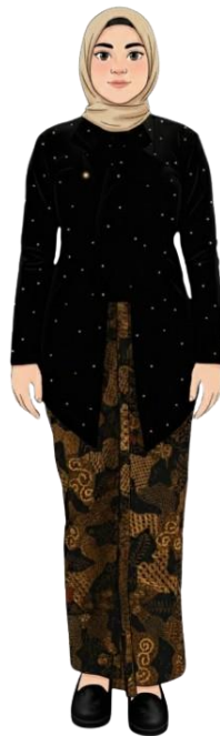
CONTOH BAJU KANCENGAN WARNA HITAM MEMAKAI BERRAS NOMPA