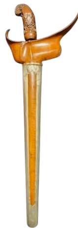
KERIS SUMENEP MOTIF WARANGKA DHAUNAN