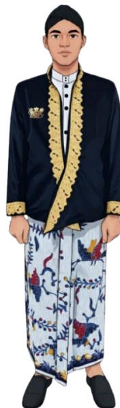
CONTOH BESKAP KANIGARA WARNA HITAM BELUDRU