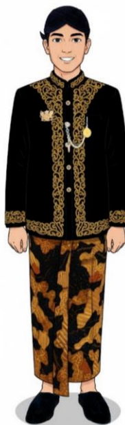
CONTOH BESKAP KANIGARA WARNA HITAM BELUDRU