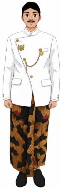
CONTOH BESKAP BILLABANTEN WARNA PUTIH