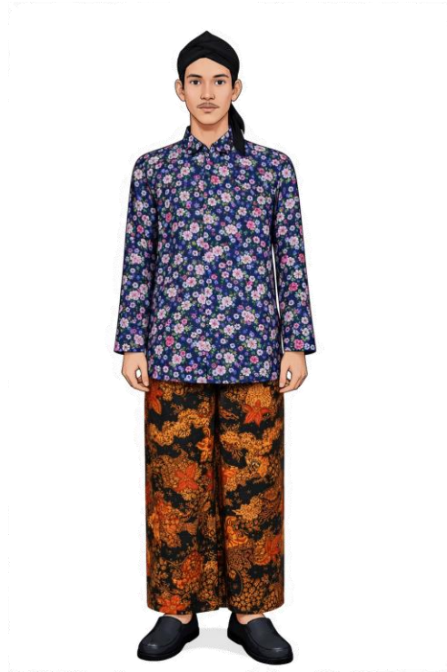
CONTOH BAJU GANALAN BILLABANTEN DENGAN WARNA DASAR GELAP DIHIASI MOTIF BUNGA SERTA DILENGKAPI MOTIF DAUN