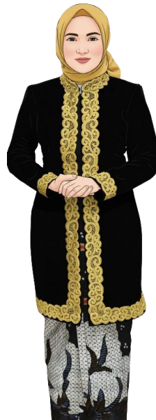
CONTOH BAJU KANCENGAN GUSTUM/KEBAYA KANIGARA WARNA HITAM BELUDRU