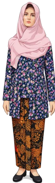
CONTOH BAJU KEBAYA DENGAN WARNA DASAR GELAP DIHASI MOTIF BUNGA SERTA DILENGKAPI MOTIF DAUN