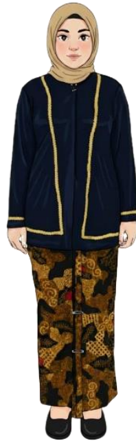
CONTOH BAJU KANCENGAN GUSTUM/KEBAYA KANIGARA WARNA HITAM BELUDRU