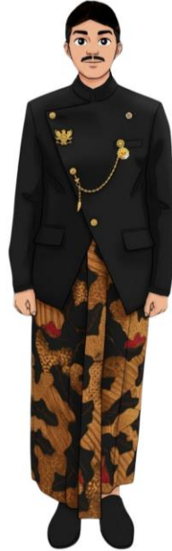
CONTOH BESKAP BILLABANTEN WARNA HITAM