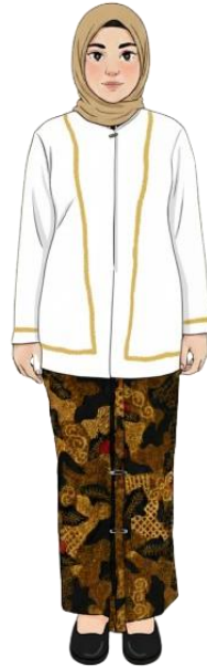
CONTOH BAJU KANCENGAN TANPA GUSTUM WARNA PUTIH BELUDRU